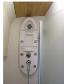
Nasszelle mit sep. Dusche

Bug: Doppelkabine mit Schränken, Stauräumen, Doppelbett.